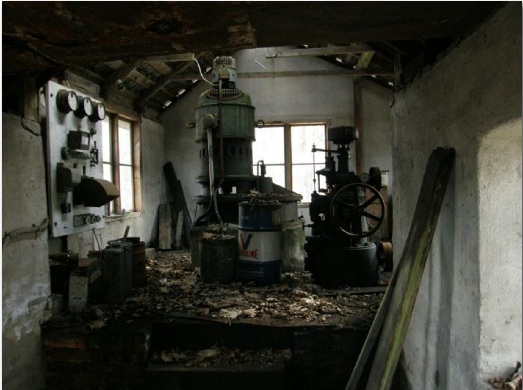
Ett foto från ett småländskt vattenkraftverk som var i drift till sent 70-tal.