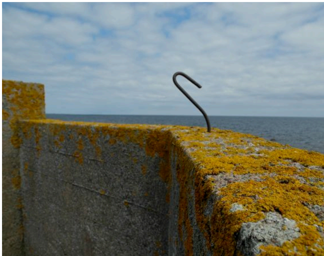
En summering av året som gått bland rost och betong