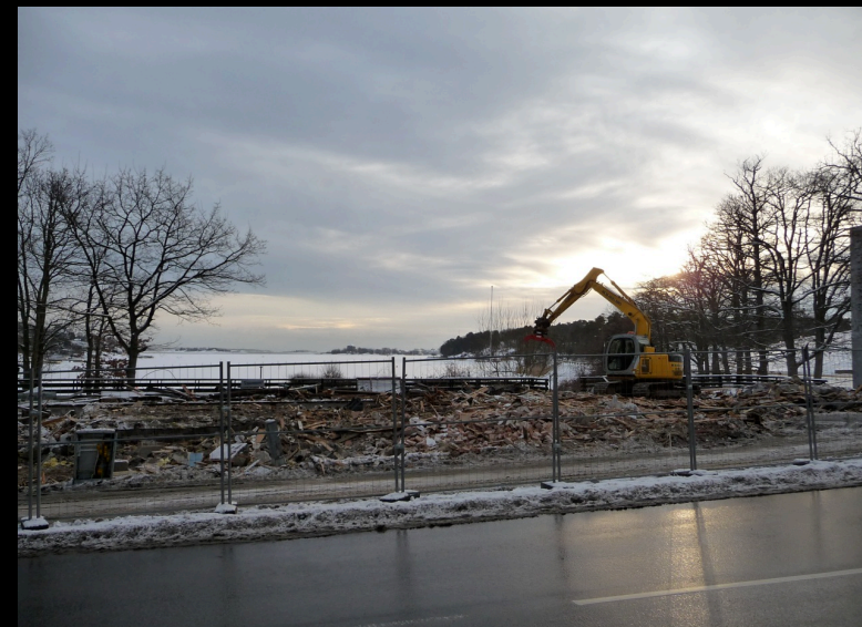
...kan vara historia i morgon