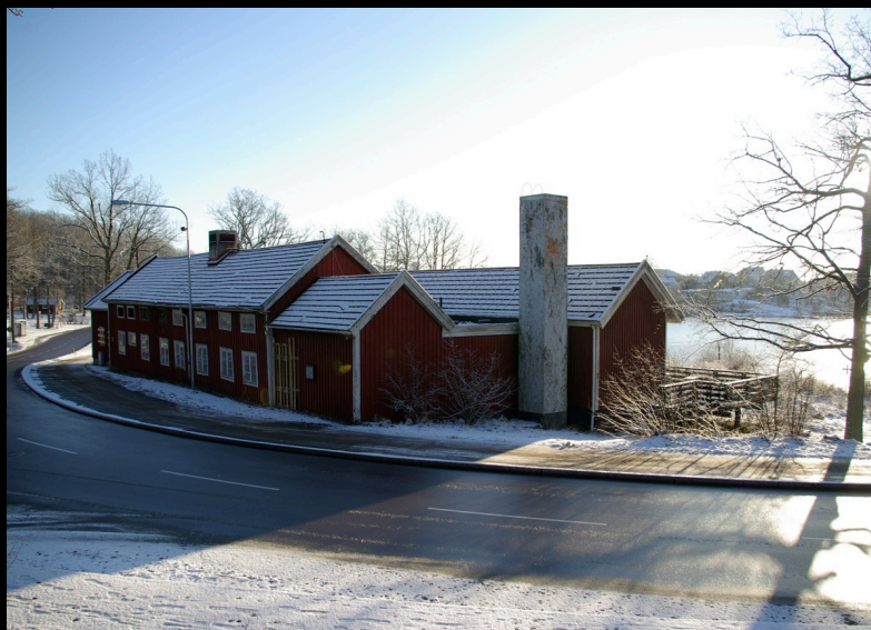
Kom ihåg; det som finns idag...